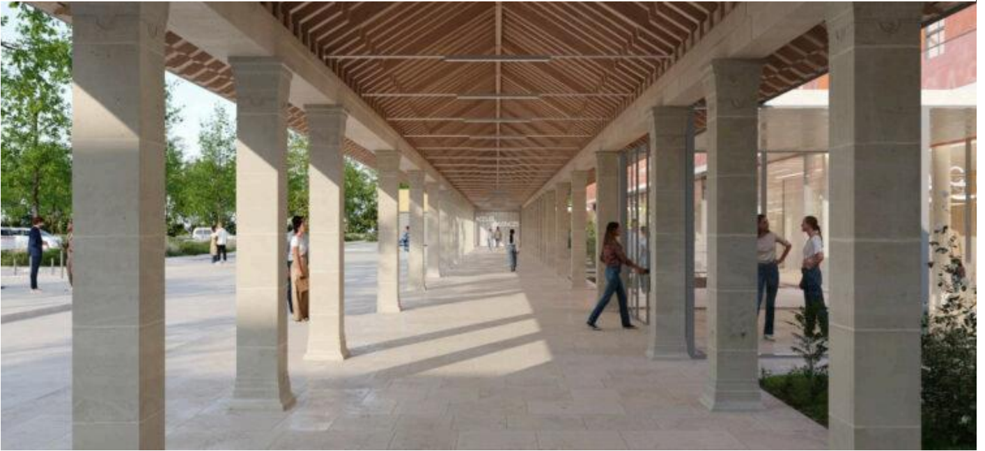
CASH de Nanterre @Pargade Architectes

Cette journée, qui illustre des réalités très différentes et souvent opposées, devrait nous éclairer sur nos marges de manœuvre pour repenser l'architecture de l'hôpital et enfin renverser la table des modèles pensés à l'avance et plus ou moins identiques.