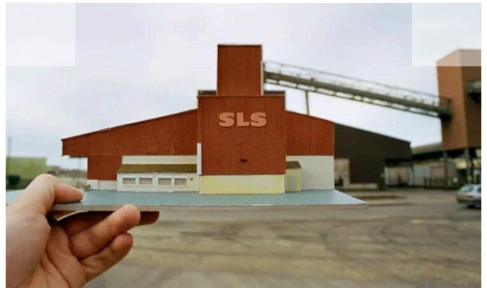
À Nantes : De toutes pièces, Sébastien Pageot